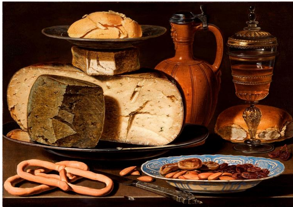
Clara Peeters, Stillleben mit Käse, Mandeln und Bretzeln, um 1615

Koninklijk Kabinet van Schilderijen Mauritshuis, Den Haag